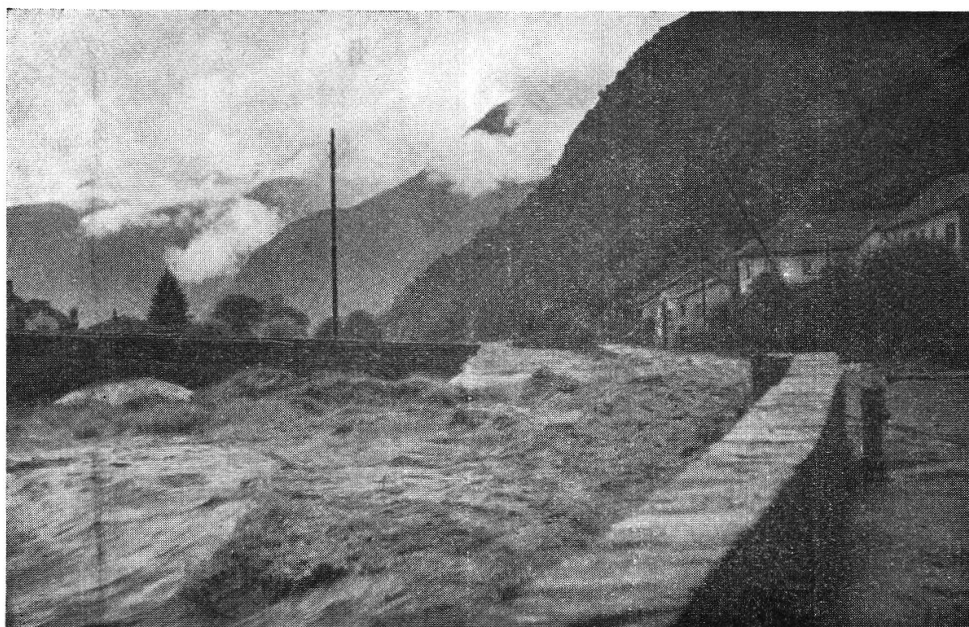
Roveredo. Durante la piena 8 VIII 1951. Il Ponte di Valle ha ceduto.

Nel tardo pomeriggio parve che il cielo volesse schiarirsi e vi fu anche un momento di sosta nella pioggia, la quale durava ormai ininterrotta e violentissima dalla mezzanotte. Ma sull'imbrunire, ripresa della pioggia torrenziale, con grande ansia delle popolazioni che si sentivano ormai esposte alle furie delle acque che ovunque avevano supe-