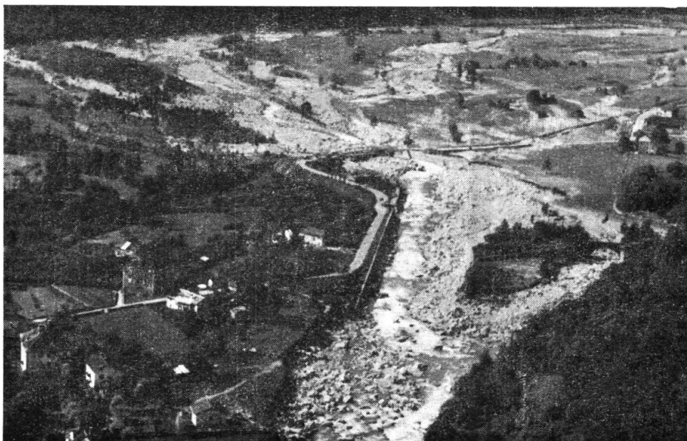
La Calancasca s'è riversata sui prati di Vera. 8 VIII 1951

Verso mezzogiorno, questo torrente, che durante la mattinata aveva impressionato per il mancato gonfiamento, sintomo certo di qualche insidioso ingorgo o serra, parve destarsi e rivelare tutta la sua violenza. Quasi improvvisamente, trascinando macigni, tronchi, alberi intieri con rami e radici, parve lanciarsi dal valloncetto scosceso ed angusto contro il villaggio, attraverso il canale pur protetto da un forte argine. In breve il canale fu ripieno di materiale, specialmente nel corso inferiore, presso lo stradale. Allora l'acqua superò gli argini, travolse cataste di tronchi, rotoli di corda metallica destinati ad una teleferica, distrusse e seppellì