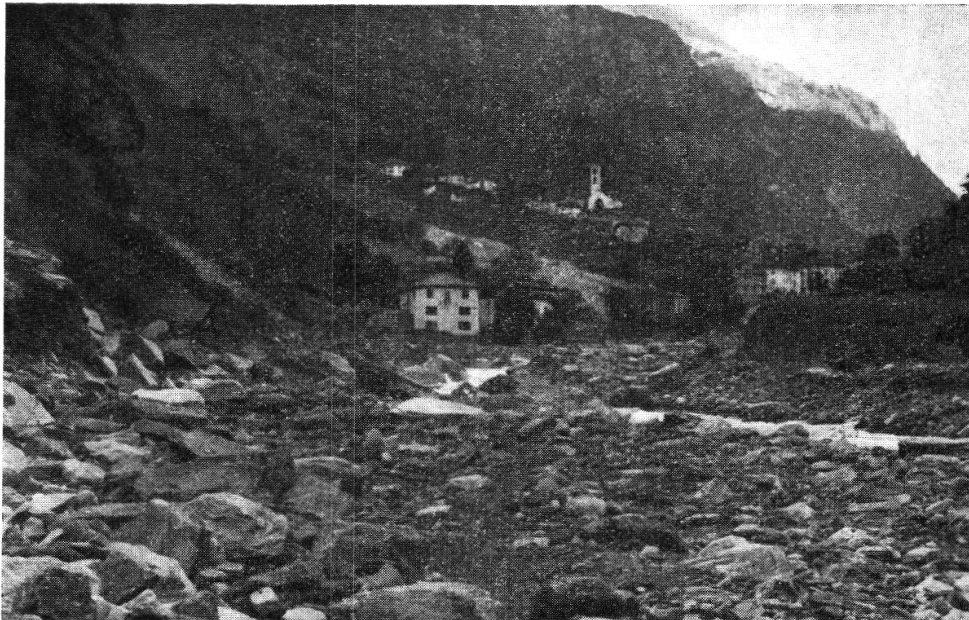
Arvigo. Dopo la piena 8 VIII 1951. La strada è stata inghiottita dalle acque. Il fondo-valle è ormai solo greto della Calancasca.

Straripando da tutte le parti la corrente investiva sulla sua destra la segheria Pacciarelli - Rigassi. Testimoni oculari ci hanno detto che fu un attimo: il fabbricato, abbastanza vasto ed ingombro di grandi