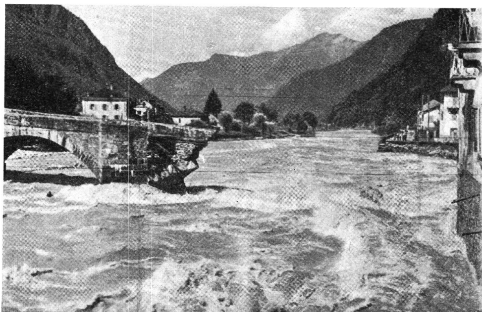
Roveredo. Dopo la piena 8 VIII 1951.

telefonico, era paurosa la notte nella fitta oscurità e senza possibilità di comunicare con il resto della Valle e del mondo. Interrotta la strada a Lumino, a San Vittore, a Roveredo e al Ponte di Ferro, danneggiata e distrutta la linea ferroviaria a Molinazzo, a Lumino e a Roveredo, erano immobilizzati in Valle i forestieri di passaggio, non potevano tornare i valligiani assenti per ragioni di lavoro, i quali poi dalle poche notizie che potevano raccogliere, potevano anche dedurre danni e catastrofi ancora maggiori. Ma il sole incoraggiava a superare il primo momento di sbalordimento e di prostrazione. Sulle strade e sulla linea ferroviaria si metteva mano ai primi lavori di sgombero, gli operai delle imprese di elettricità e quelli dell'amministrazione dei telefoni si prodi-