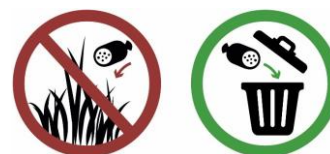
Immagine: Grafici USAV